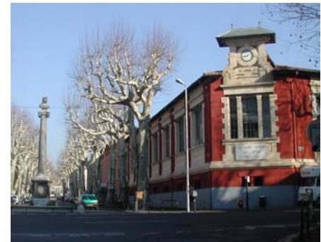
Stationnement dans la cour de l'Ecole